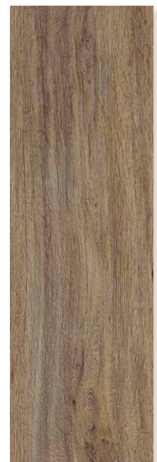
OAK LIGHT BROWN